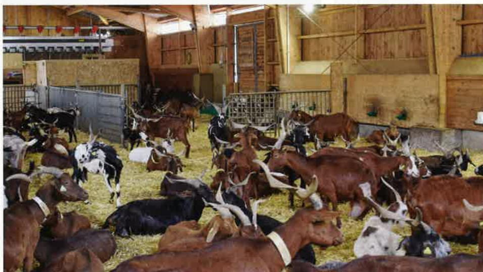
Les associations de défense des races, accompagnées par l'Institut de l'élevage, ont souhaité créer des références pour montrer que s'installer en race locale et vivre de ce type d'élevage c'est possible.

La France métropolitaine et la Corse comptent neuf races locales dont la plupart ont survécu grâce à la détermination d'éleveurs passionnés qui ont cherché à conserver cette biodiversité domestique menacée de disparition ainsi que les systèmes traditionnels associés. Ces races sont finalement encore assez mal connues et souffrent parfois de stéréotypes, ce qui peut être un frein à l'installation. C'est pourquoi les associations de défense de ces différentes races accompagnées par l'Institut de l'élevage, ont souhaité créer des références pour montrer que s'installer en race locale et vivre de ce type d'élevage c'est possible.